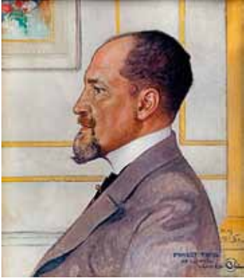
Carl Larsson: Porträtt av Ernest Thiel, 1915. Olja på duk 60 x 53 cm. Thielska Galleriet.

Thielska Galleriet på Djurgården i Stockholm är egentligen ett konstverk i sig själv där arkitektur och inredningar i samspel med omgivningarna skapar en helhet. Det är ett hus med plats för alla konstarter, men det är utom allt tvivel att det är konstsamlingen som är huvudattraktionen. Den här artikeln berättar om Ernest Thiels verksamhet som affärsman och som kulturmecenat. Men istället för att se det som två åtskilda områden visas på beröringspunkterna mellan affärsstrategierna och kärleken till konsten.