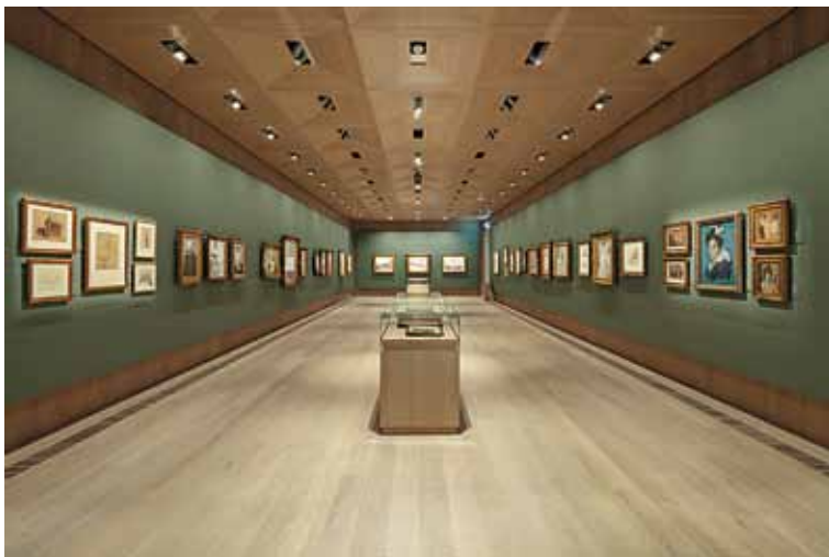
Den franske samling sal 03, Ordrupgaard.