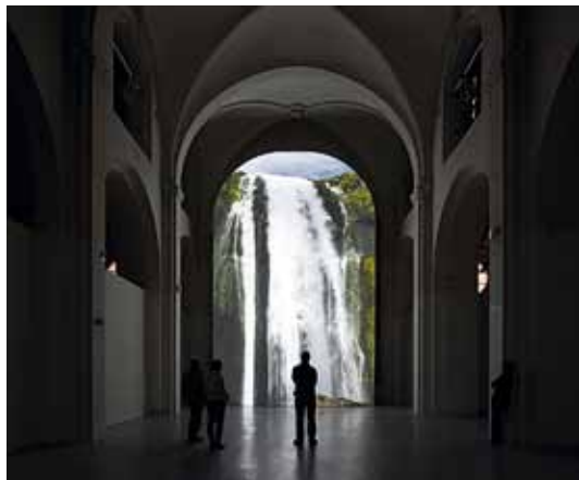
Eva Koch: I Am the River, 2012. Videoinstallation 12 x 7 m. Nikolaj Kunsthal, København