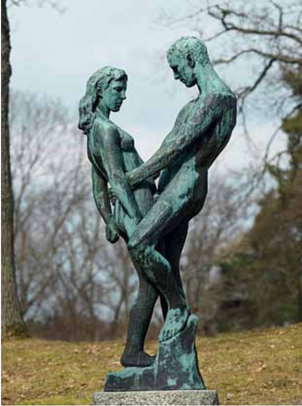
Gustav Vigeland: Man och kvinna, 1906. Brons, höjd 190. Thielska Galleriet.