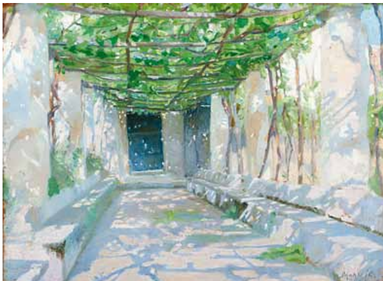
Marie Krøyer: Solbeskinnet pergola fra Ravello, 1890. Olie på træ – 32 x 42,5 cm. Skagens Kunstmuseer.