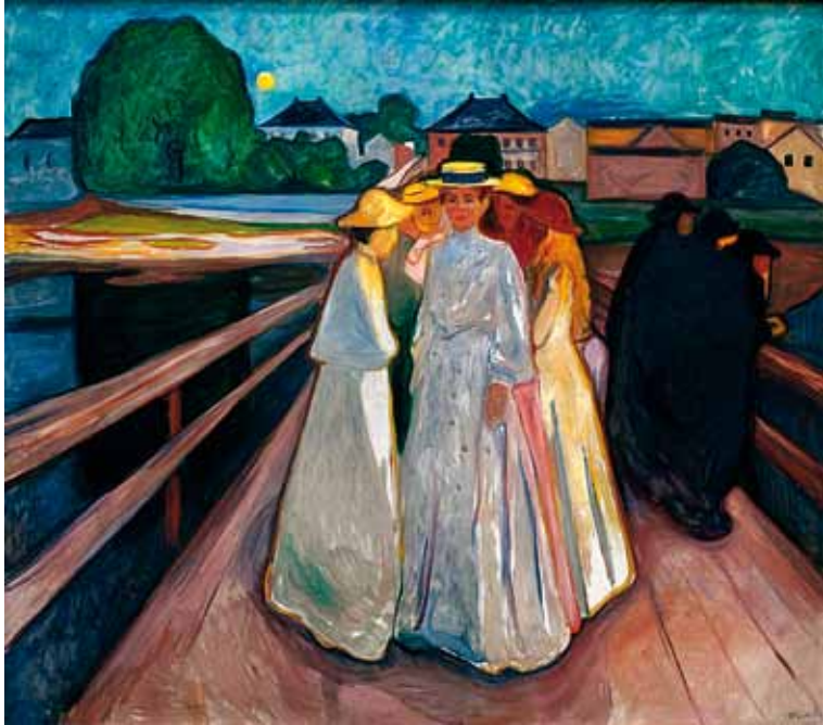
Edvard Munch: På bron, 1903. Olja på duk, 203 x 230. Thielska Galleriet.