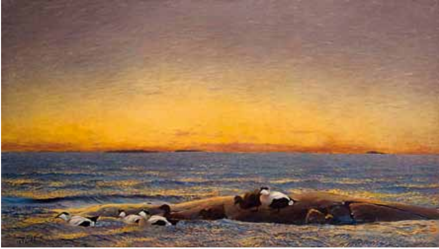
Bruno Liljefors: Morgonstämning vid havet, 1896. Olja på duk, 119 x 209. Thielska Galleriet.