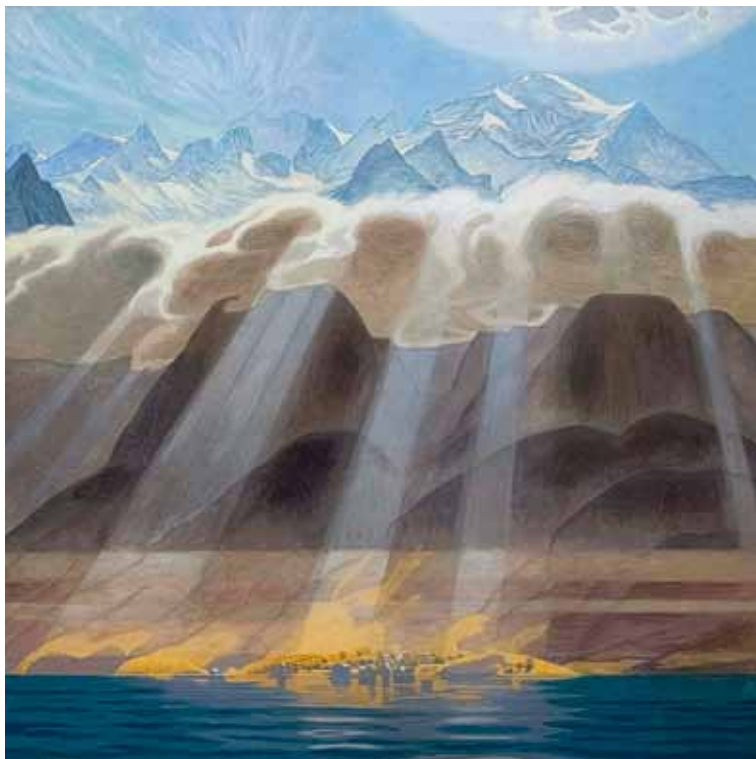
Jens Ferdinand Willumsen: Sol över Söderns berg , 1902. Olja på duk, 209 x 208. Thielska Galleriet.