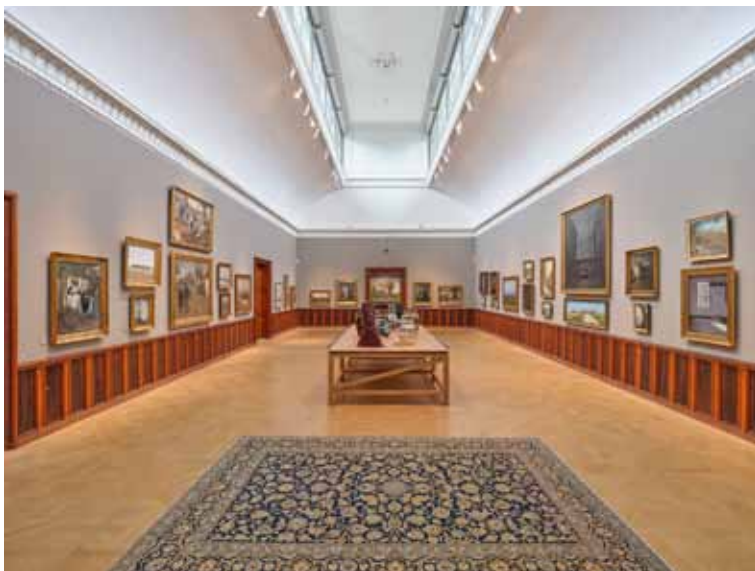
Nye danske sale. Hammershøi, Ring og deres tid.