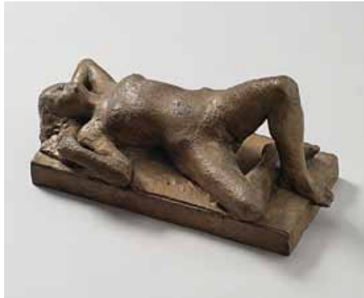
Astrid Noack: Liggende nøgen kvinde, 1934. Bronze 20,7 x 43,7 x 21,8 cm. SMK, København

Inspiration fra naturen er ligeledes gennemgående. For nogle kunstnere er det farverne i naturen, der er kilde til nye frembringelser. For andre er det den rumlige eller de strømmende kræfter i den omgivende natur, der kan inspirere og tjene som spejl. Der flyder meget vand i Eva Kochs (født 1953) videoværker. Et helt overvældende og teatralisk værk er Eva Kochs videoinstallation ”I Am The River” (2012), Nikolaj Kunsthal, i den tidligere Nikolaj Kirke i København. Værket drejer sig om det enkelte menneskes forhold til naturen og specielt om kunstnerens identifikation med den strømmende kraft i vandfaldet. Det bliver et billede på kunstnerisk skaberkraft og på forbindelsen mellem naturens kræfter og menneskets forståelse af sig selv som en del af naturen, omsluttet og ikke blot som iagttagere.