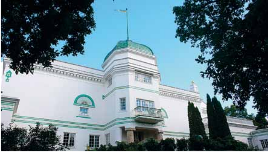
Ferdinand Boberg: Thielska Galleriet, 1904-1907.

naturliga ljuset skulle kunna sprida ut sig jämnt och mjukt över konstverken. Salarna med konst fungerade som sällskapsvåning, med matsal och salong. Skulpturer placerades i den muromgärdade parken som har en naturlig karaktär, vilket låg i tiden. 3 Konsten skulle vara en del av sällskapslivet på Thielska.